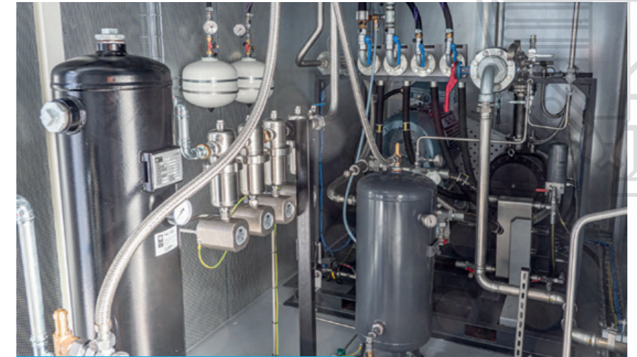
Wassergekühlter CNK9-55 Schraubenverdichter

Biomethan in ein 4-Bar-Netz ein, das für den Brauprozess in der Brauerei verwendet wird. Nach dem Verdichten wird das Biomethan nochmals gereinigt und auf ca. 20°C heruntergekühlt. Bei geringer Abnahme im Brauprozess wird auf den zweiten Verdichter, einen wassergekühlten CS23.8-37-Mitteldruckverdichter, umgeschaltet. Dieser BAUER Hochdruckbooster kann hohen Vordruck verarbeiten, was den Energiebedarf signifikant reduziert. Die Einhausung der Verdichter in geheizten und belüfteten Containern erlaubt den Betrieb auch unter stark schwankenden Außenbedingungen. Mit der Inbetrieb-