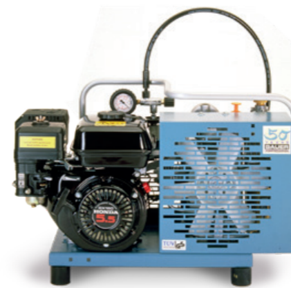
Der JUNIOR 1995 als Sonderedition zum 50-jährigen Firmenjubiläum, ein Jahr nach Markteinführung in der benzingetriebenen Variante