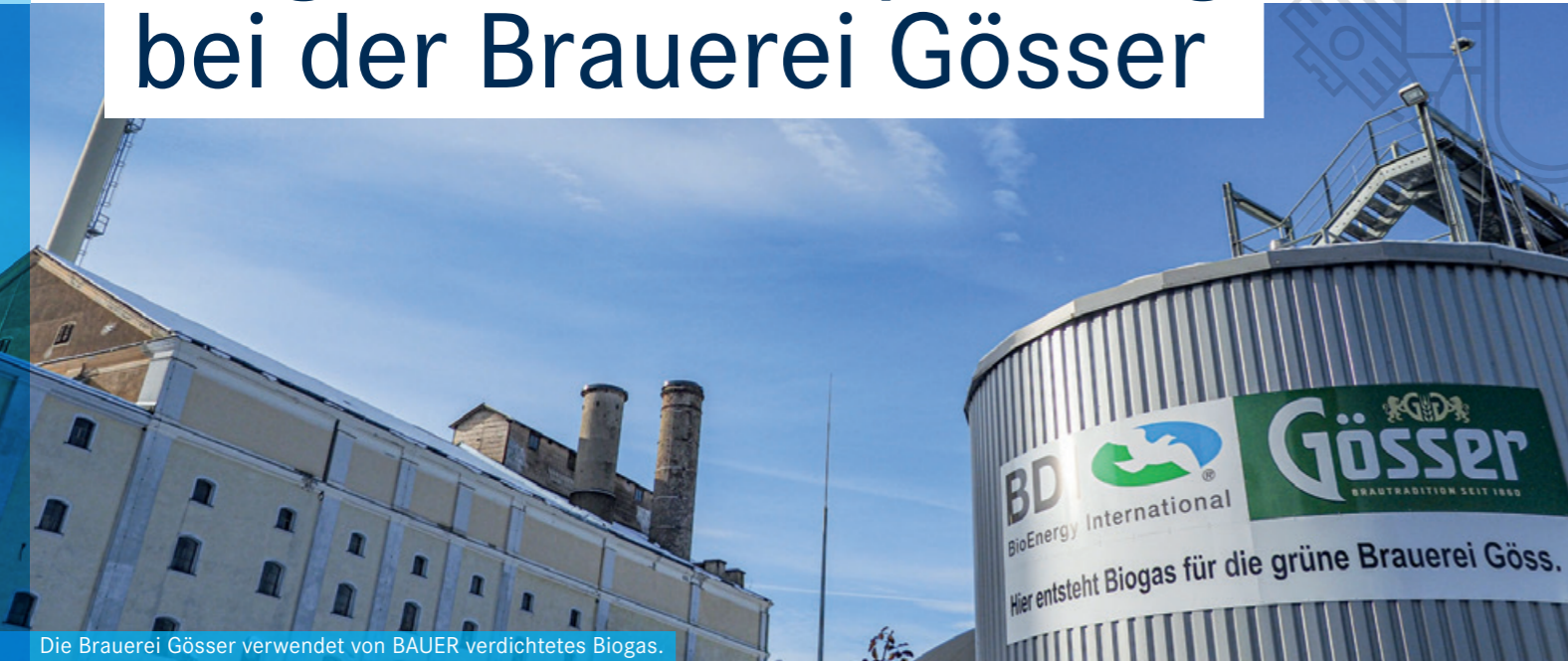
Die Brauerei Gösser verwendet von BAUER verdichtetes Biogas.

Die bekannteste österreichische Biermarke auf dem internationalen Markt ist das zur Brau Union gehörende Gösser. Die Brauerei im steirischen Leoben kann auf eine Tradition zurückblicken: Die vom Nonnenstift Göss gestartete und später eingestellte Brautätigkeit wurde 1860 vom Bierbrauer Max Kober erfolgreich reaktiviert. Heute steht die Farbe Grün im Logo auch für das Bemühen um eine klimafreundliche Unternehmenspolitik.