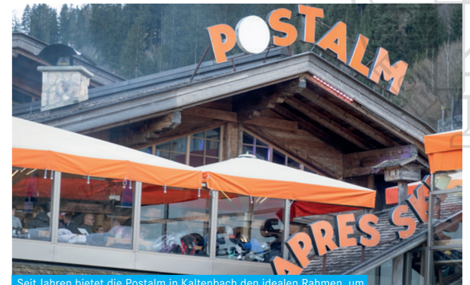
Seit Jahren bietet die Postalm in Kaltenbach den idealen Rahmen, um einen tollen Skitag perfekt ausklingen zu lassen.

des Wissen und Verständnis über eines unserer wichtigsten Organe. Die Teilnehmenden lernten in dem zweistündigen Kurs wichtige praktische Übungen, um die Augen wirksam zu entlasten bzw. zu trainieren.