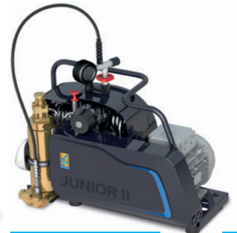
Die dritte Generation glänzt ab 2022 unter anderem mit einer nochmals optimierten Kühlluftführung und State-of-the-Art-Design.