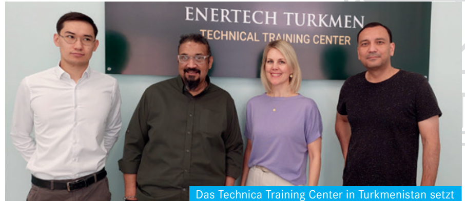
Das Technica Training Center in Turkmenistan setzt künftig auf Atemluft von BAUER KOMPRESSOREN

(Öl- und Gasmesse Usbekistan) in der Hauptstadt Taschkent präsentierten sich Hersteller mit unterschiedlichsten branchenspezifischen Produktlösungen. Besonders im Bereich Atemluft kann BAUER hier ein breites Portfolio an Lösungen vorweisen: H 2 S-Protection Systeme schützen Mitarbeitende im Falle gefährlicher Schwefelwasserstoff-Blowouts durch eine sichere Versorgung mit Atemluft in den Schutzräumen, und das marktführende Online-Gasmesssystem