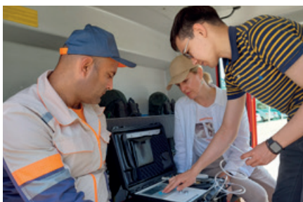
Präsentation von B-DETECTION bei Uzbekneftegaz