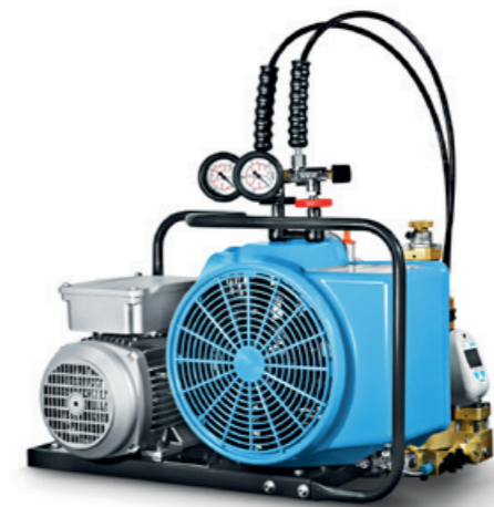
Bereits im Jahr 1997 erhält der JUNIOR, hier in der Wechselstromvariante, einen neuen Lüfterrad- und Riemenschutz aus schlagfestem Spezialkunststoff.