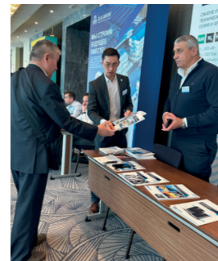
Das BAUER Team im Kundengespräch

Ohne seltene Erden wäre der schnelle Ausbau von klimaschützenden Technologien für die Solarstromerzeugung und Elektromobilität nicht denkbar. Die sichere Versorgung mit diesen Grundmaterialien ist wirtschaftspolitisch von strategischer Bedeutung. Aus diesem Grund rückt das zentralasiatische Kasachstan als politisch stabiler Staat mit bedeutenden Lagerstätten international immer stärker in den Fokus. Der Mitte Mai in der Hauptstadt Astana stattgefunden „Mining Congress Quasaqstan“ hat sich mit seinem interessanten Mix aus Vorträgen und Ausstellern inzwischen als wichtigstes lokales Forum und Treffpunkt der Branche etabliert. BAUER