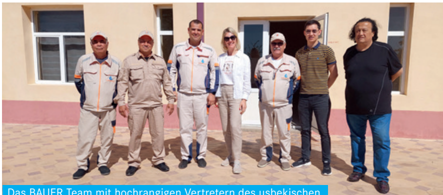
Das BAUER Team mit hochrangigen Vertretern des usbekischen Trainingscenters für Löscheinsätze und Feuerwehr

Auch die benachbarten Länder Usbekistan und Turkmenistan gewinnen als Gas-, Öl- und Rohstofflieferanten immer stärker an Bedeutung. Als Premiumhersteller im Bereich Hochdrucksysteme genießt BAUER in der Region einen exzellenten Ruf, wie ein Team von BAUER auf einer Reise im Anschluss an den Kongressbesuch feststellen konnte. Bei diversen Explorationsstandorten und Trainingszentren liefern BAUER Verdichter teils schon seit Jahrzehnten zuverlässig beste Atemluftqualität! Als erstes Ziel der Tour stand Usbekistan auf dem Reiseplan. Bei der OSG