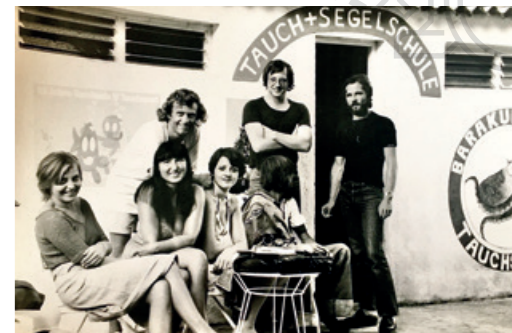
Tauchschule Cala Canyamel auf Mallorca in den 70er-Jahren