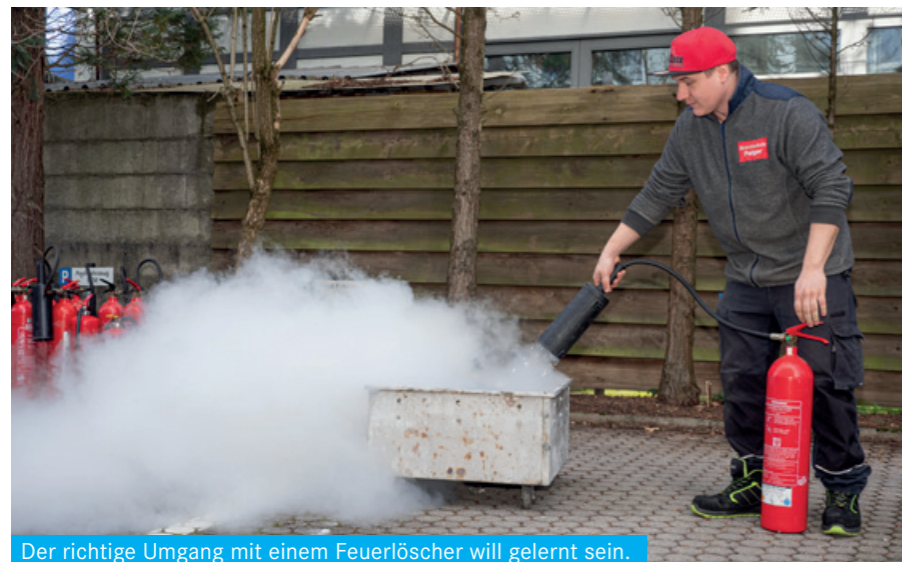
Der richtige Umgang mit einem Feuerlöscher will gelernt sein.