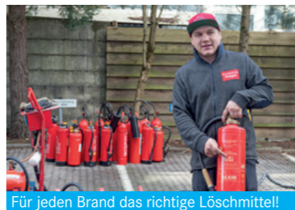
Für jeden Brand das richtige Löschmittel!