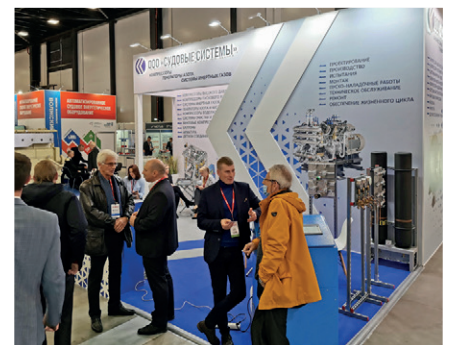
Erfolg auf der NEVA mit maßgeschneiderten Lösungen

Im Industriebereich präsentierte Partner SHIP SYSTEMS die Palette der von BAUER speziell für den Schiffseinsatz entwickelte Großkompressoren. In ihrer Kombination aus höchster technischer Performance und besonders kompakter Bauweise erfahren die wassergekühlten Modelle BK 26 und BK 52 im Werftbereich eine besonders starke Nachfrage. Ein weiteres wichtiges und erfolgreiches Produktfeld stellen Stickstoffgeneratoren dar, die in Zusammenarbeit mit SHIP SYSTEMS als Packages entwickelt wurden. ■