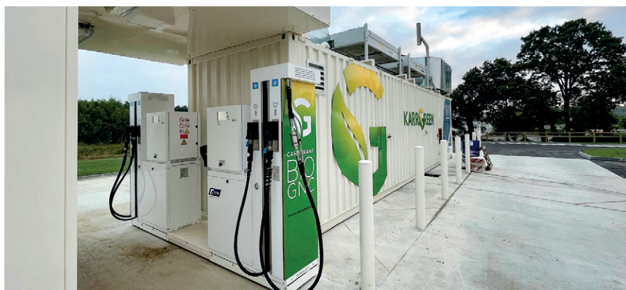
Biogastankstelle in Ploërmel

Mit dem neuen C26 XXL-Mobile CNG-System gelang der amerikanischen Niederlassung BAUER COMPRESSORS INC. (BCI) die Entwicklung eines besonders vielseitigen und flexiblen Konzepts, das auf dem Erdgasmarkt auf entsprechend große Nachfrage stößt. Anfang Oktober erfolgte die Auslieferung bereits des zweiten Systems an das Unternehmen Cleancor LLC. Der Kunde nutzt das mobile CNG-System für seine bestehenden Erdgas-Stationen, um deren Betankungskapazität durch die Möglichkeit der Einspeisung mit Flüssiggas (LNG) zu erweitern. Das erste System ging in Palm Springs, Kalifornien, in Betrieb. Auch hier setzt der lokale Energieversorger das System auf gleiche Weise ein, um die begrenzte Liefermenge der bestehenden Erdgaspipeline zu kompensieren. Nach Abschluss des Ausbaus der Pipeline-Kapazität wird dort eine neue stationäre C52.12 X-Fill™ von BCI in Betrieb gehen. Dank mobiler Bauweise kann die bestehende C26 XXL-Anlage anschlie-