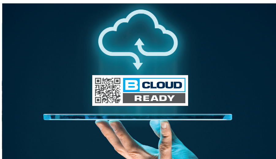
Dank B-CLOUD immer im Bild

Für Kunden von BAUER stellt die neu geschaffene Cloudplattform B-CLOUD einen Quantensprung dar, was den Komfort und die Sicherheit beim Anlagenbetrieb betrifft: Alle stationäre Anlagen und Gasmesssysteme, die mit der neuesten Steuerungsgeneration B-CONTROL MICRO+net ausgestattet sind, können ihre Betriebsdaten in die B-CLOUD übertragen, die damit über Smartphone oder Rechner des Kunden abrufbar sind. Lückenloses Condition Monitoring erlaubt die Kontrolle wichtiger Daten wie Temperatur, Betriebsdruck, Öldruck, Filterpatronensättigung oder Gasmesswerten. Diese lassen sich jetzt unabhängig vom Standort der Anlage jederzeit und weltweit in nahezu Echtzeit abrufen. Wartungsmeldungen wie ein anstehender Filterpatronenwechsel oder Störmeldungen wie Öldruckab-