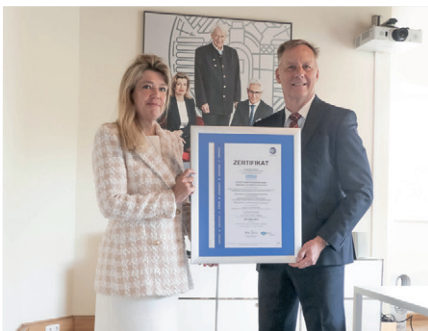
BAUER macht sich für die Umwelt stark.