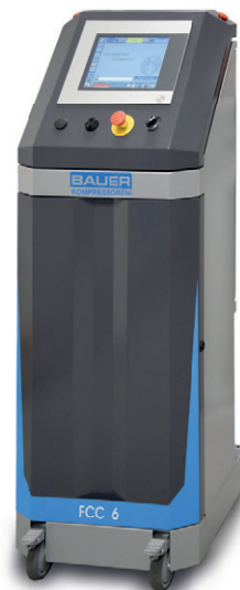
Präzision „Next Generation“

Gasinnendrucktechnik, kurz GIT, bezeichnet ein Verfahren, bei dem mittels Stickstoff während des Spritzprozesses das heiße und deshalb noch plastische Innere eines großvolumigen Spritzgießteiles so ausgepresst wird, dass ein rohrförmiger Kanal entsteht. Das Ergebnis sind stabilere und leichtere