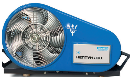
NETPUN – lokal produziert in BAUER Qualität