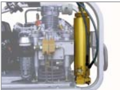
Super-TRIPLEX P 31