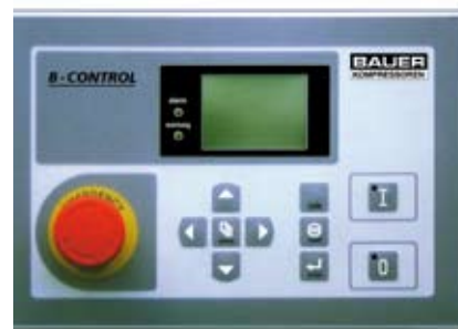
Система управления компрессора B-CONTROL